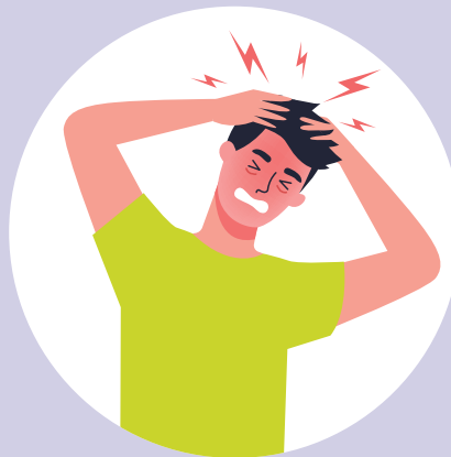
ZBUNJENOST, NEMOGUĆNOST KONCENTRIRANJA